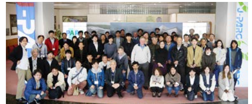
現地参加者の集合写真

ワークショップでは、プレナリーセッションとJ-PARCハドロン施設での主要な研究分野であるハドロン物理・ストレンジネス核物理・フレーバー物理の3つのパラレルセッションを設けました。89の講演があり、加速器や実験施設の拡張計画、そこでの物理に関する実験・理論両面からの最新の研究状況が議論されました。また現施設での研究についても幅広く活発に議論されました。188名の参加登録者のうち59名が国外機関からの参加で、60名程度の現地参加者のうち10名は海外からの参加者でした。コロナ後の本格的な国際ワークショップで、多くの研究者が参加し、対面で議論ができたことは、大きな成果でした。拡張計画について継続的に議論していくことにより、実験分野・理論分野ともに、多くの研究が活発に進んでいることが印象付けられました。