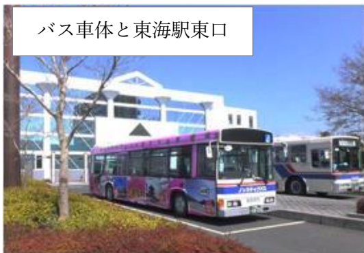
バス車体と東海駅東口

J-PARC／ユーザーズオフィスへお越しの際は、「原研前（ゲンケンマエ）」で乗降車ください。