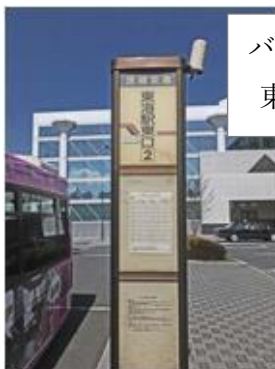
バス停（東海駅東口）