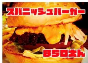
スパニッシュバーガー 850Yen SPANISH BURGER