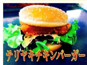
テリヤキチキンバーガー 700Yen TERIYAKI CHICKEN BURGER

老若男女問わず大好きな永遠の味 オリジナルのテリヤキが 130gのパティとの相性抜群です。