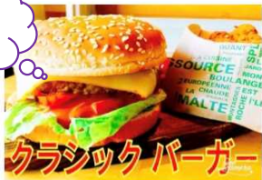
クラシックバーガー 800Yen CLASSIC BURGER