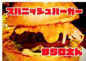
スパニッシュバーガー 850Yen SPANISH BURGER