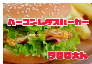
ベーコンレタスバーガー 900Yen BACON & LETTUCE BURGER

これこそ王道のジャンクフード ベーコンの旨味とバーガーのポ リューミーを楽しめるバーガー です。