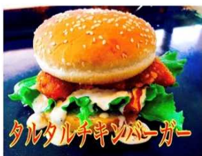
タルタルチキンバーガー 700Yen CHICKEN & TARTAR-SAUCE