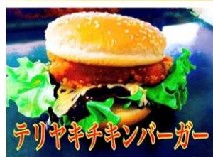
テリヤキチキンバーガー 700Yen TERIYAKI CHICKEN BURGER

老若男女問わず大好きな永遠の味 オリジナルのテリヤキが 130gのパティとの相性抜群です。