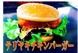
テリヤキチキンバーガー 700Yen TERIYAKI CHICKEN BURGER

老若男女問わず大好きな永遠の味 オリジナルのテリヤキが130gのパティとの相性抜群です。