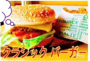
クラシックバーガー 800Yen CLASSIC BURGER