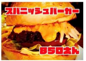
スパニッシュバーガー 850Yen SPANISH BURGER