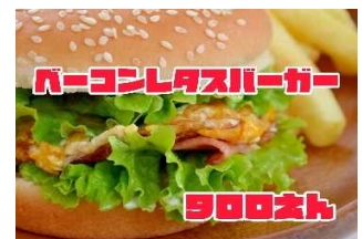
ベーコンレタスバーガー 900Yen BACON & LETTUCE BURGER

これこそ王道のジャンクフード ベーコンの旨味とバーガーのボリュームを楽しめるバーガーです。