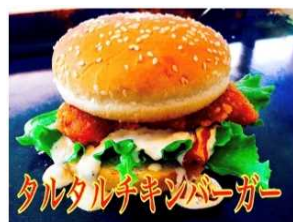
タルタルチキンバーガー 700Yen CHICKEN & TARTAR-SAUCE