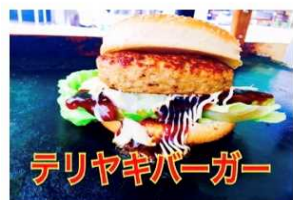
テリヤキバーガー 750Yen TERIYAKI BURGER

老若男女問わず大好きな永遠の味 オリジナルのテリヤキが130gのパティとの相性抜群です。