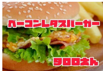
ベーコンレタスバーガー

ベーコンレタスバーガー 900Yen BACON & LETTUCE BURGER