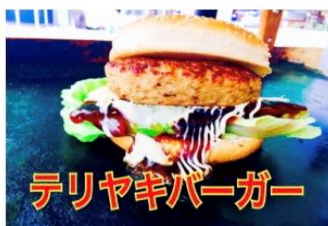
テリヤキバーガー