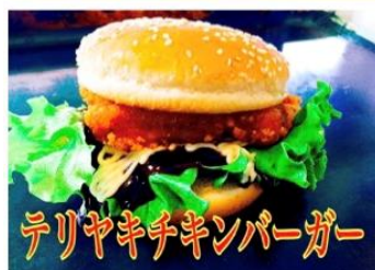
テリヤキチキンバーガー

老若男女問わず大好きな永遠の味 オリジナルのテリヤキが 130gのパティとの相性抜群です。