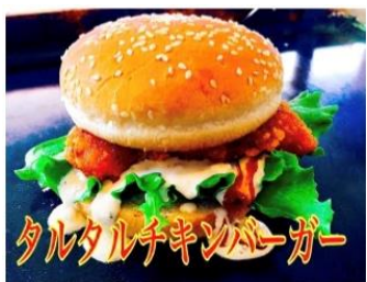
タルタルチキンバーガー

タルタルチキンバーガー 700Yen CHIKEN & TARTAR-SAUCE