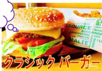
クラシックバーガー