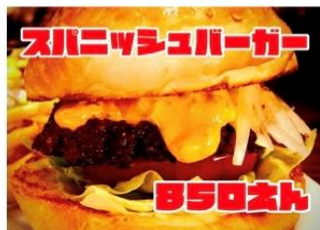
スパニッシュバーガー

タルタルチキンバーガー 700Yen CHIKEN & TARTAR-SAUCE