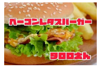
ベーコンレタスバーガー 900Yen BACON & LETTUCE BURGER

これこそ王道のジャンクフード ベーコンの旨味とバーガーのボ リューミーを楽しめるバーガー です。