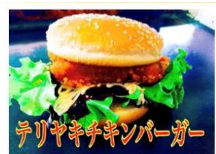
テリヤキチキンバーガー 700Yen TERIYAKI CHICKEN BURGER

老若男女問わず大好きな永遠の味 オリジナルのテリヤキが 130gのパティとの相性抜群です。