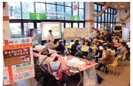
チョコレート・サイエンスの様子

※共催:KEK物質構造科学研究所、後援:東海村教育委員会、協力:東京フード株式会社