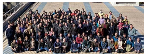
参加者の集合写真

今回は3年ぶりのオンサイト開催となり、海外からの研究者も含め115名が参加しました。ニュートリノビーム増強のためのMR(Main Ring)の長いシャットダウンを経て、T2K実験は4月に約2年ぶりに実験を再開する予定です。2009年の実験開始時の目標であったビーム強度750kWを越えた運転が可能になります。またJ-PARC内に設置されている前置検出器の改良作業も進行中です。ミーティングではこれらの進展が報告され、活発な議論が行われました。