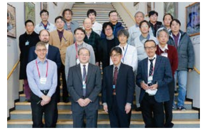
A-TAC参加者の集合写真

ビーム利用運転に対して、物質・生命科学実験施設(MLF)で730-830kWのビームパワーで稼働率約96%の利用運転を実施したことに対して高い評価を受けました。また、電力料金高騰による、ビーム利用運転時間減少に対して、対応策を検討するようにとの提言がありました。