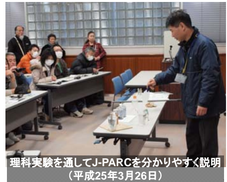
理科実験を通してJ-PARCを分かりやすく説明 (平成25年3月26日)