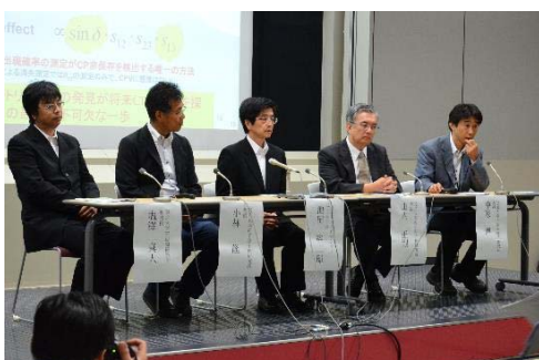
成果の社会に対する発信の例 (2013年7月19日のT2K記者発表)